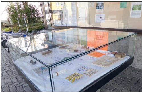
Posten 9: Umweltfreundliche Entsorgung

Anstelle des traditionellen Suppenfestes im März hat die Kirche Bolligen den ersten «Klima-Trail» auf die Beine gestellt. So gibt es 25 Posten zu entdecken, die alle in irgendeiner Form vom Thema Klima handeln. Gestaltet wurden diese von Leuten aus der Bevölkerung sowie aus den Bereichen Vereine, Parteien, Schule und Kirche. Der «Klima-Trail» eignet sich auch für Kinder, wobei die Posten nicht der Reihe nach besucht werden müssen.