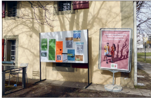
Posten 3: Reduce, Refuse, Reuse, Repair, Recycle