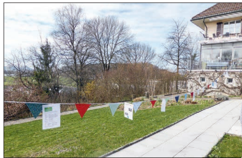
Posten 10: Nachhaltigkeit in Hauswirtschaft, Gastronomie und Wohnen