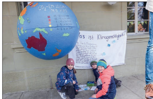
Posten 12: Klima(un)gerechtigkeit?