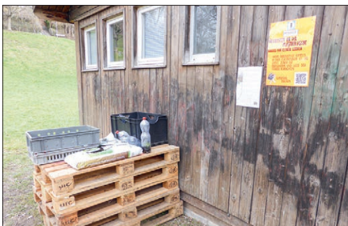
Posten 13: Ökosystem in der Plastikflasche