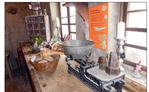
Posten 22: Lokal, saisonal und clever einkaufen