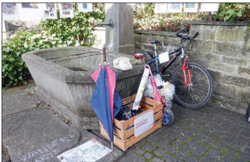
Posten 11: Klimagerechtigkeit – jetzt. Was tragen wir dazu bei?