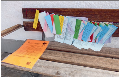
Posten 2: Klimagerechtigkeit und Kirche?!