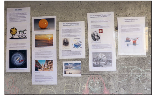
Posten 7: Sunnestrahle, heiz emal